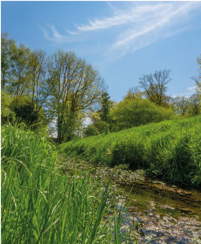
Das Biotop im LWH-Garten