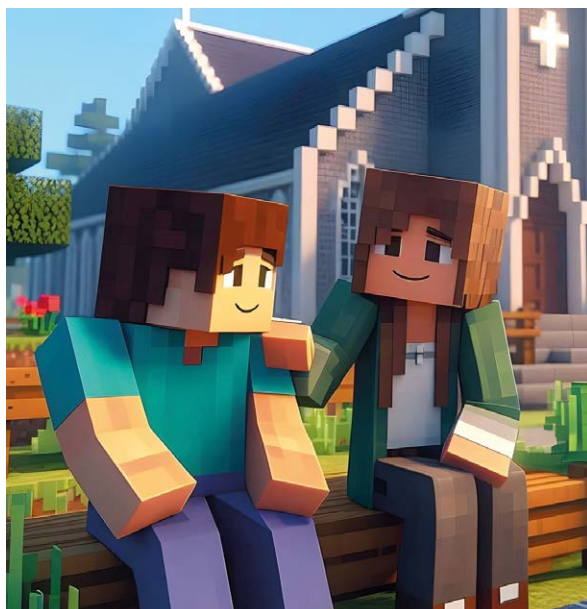
Wie digital muss/soll Seelsorge heute sein?